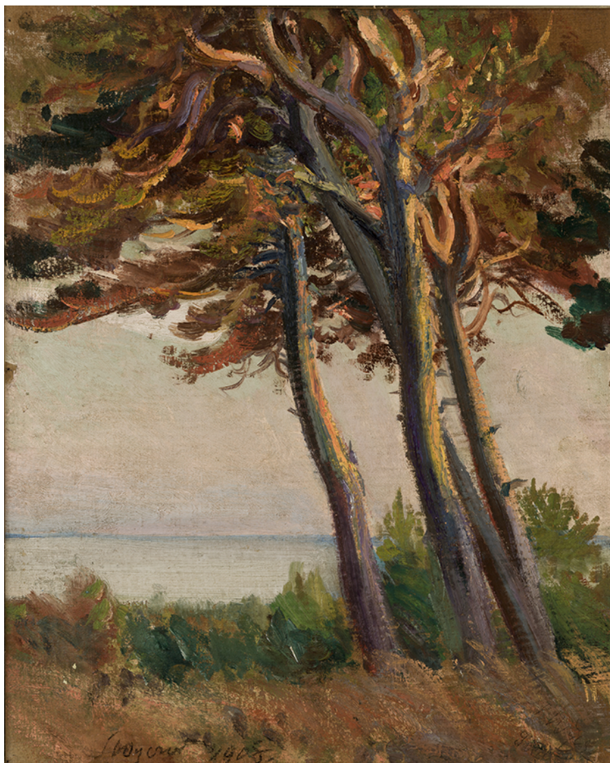
Rycina 4 Leon Wyczółkowski, Sosny w Połudze , Kraków, Muzeum Narodowe, 1908 r. (fot. https://commons.wikimedia.org/wiki/File:Leon_Wyczółkowski_-_Pines_at_Poługa_-_MNK_II-b-775_-_National_Museum_Kraków.jpg ).

były w przeszłości najbardziej popularne, być może dlatego, że i wówczas znacznie częściej duże skupiska drzew określano jako las, niezależnie od typu siedliska – lasowe czy borowe. Można jednak postawić tezę, że w miarę rozwoju różnych typów gospodarki leśnej, związanych z tych zawodów i stosowanych narzędzi, wzrastała rola identyfikacyjna tej kategorii terminów w odniesieniu do ludzi, skoro należy do niej co trzecie z najpopularniejszych nazwisk. Trzeba mieć na uwadze, że powstające z czasem nowe antroponimy cechowały się znacznie mniejszą frekwencją, co zapewne skutkuje tym, że obecnie ich liczebność nie przekracza 1000 przypadków, które przyjęto jako wartość graniczną dla popularności nazwisk. Tylko najpopularniejsze nazwiska odleśne nosi ponad 1,8 mln mieszkańców Polski, lecz gdyby dodać do tej liczby wszystkie inne przypadki z niższą frekwencją, liczba ta zapewne sięgnęłaby 2 mln. Oznacza to, że częściej niż co dwudziesty mieszkaniec kraju posiada nazwisko rodowe nawiązujące do lasów, zatem powiedzenie: „Las to ojciec nasz...” (Masłowska & Masłowski, 2003) wydaje się uprawnione.