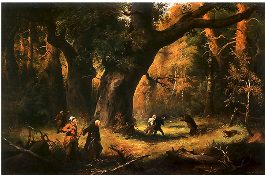
Rycina 3 Franciszek Kostrzewski, Polowanie, ilustracja do IV księgi Pana Tadeusza , Kielce, Muzeum Narodowe, 1886 r. (fot. https://commons.wikimedia.org/wiki/File:KostrzewskiFranciszek.Polowanie.1886.jpg ).

W niniejszym artykule starano się wskazać na „ojcostwo” nazw miejscowości wywodzących się od dawnych lasów i puszczy oraz ich rozprzestrzenienie w granicach dzisiejszej Polski.