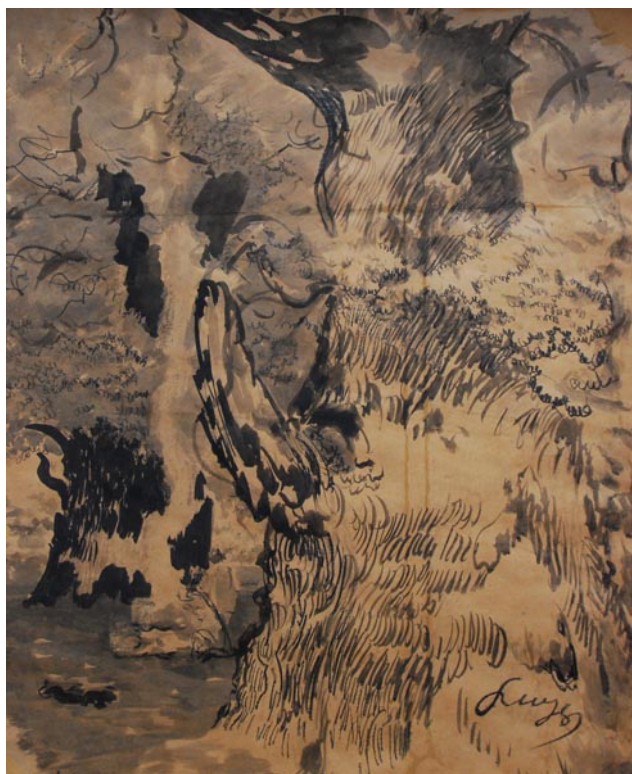
Rycina 5 Leon Wyczółkowski, Dąb rogański , przed 1936 r..

dawne lasy mogły pokrywać niemal cały obszar dzisiejszej Polski (Olaczek, 1995; Szuflet, 2005). Obecnie lesistość kraju wynosi 30,9% i jest wciąż o 4% niższa od średniej europejskiej, chociaż po II wojnie światowej wzrosła o blisko 9% (Zajączkowski et al., 2021). Najcenniejsze obszary leśne podlegają ochronie w parkach narodowych i licznych rezerwach przyrody, z których ok. 60 ma w nazwie las ( Centralny rejestr form ochrony przyrody , 2022). Z kolei obiekty z nazwą wskazującą na związek z dawnymi puszciami są tylko w MAZ (rezerwaty Puszcza Mariańska, Puszcza Słupecka i Puszcza u Źródeł Radomki) oraz PDL (Lasy Naturalne Puszczy Białowieskiej i Lipiny w Puszczy Białowieskiej).